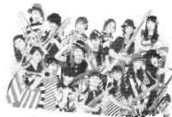
「たをやめオルケスタ」初登場!